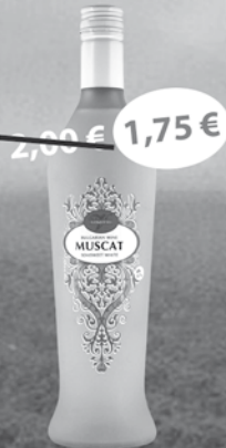
Izabela Muškát biele polosladké 0,7 l