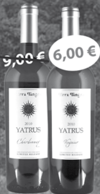
Yatrus Sauvignon Blanc 0,75 l Yatrus Viognier 0,75 l Yatrus Chardonnay 0,75 l Yatrus Tamianka 0,75 l