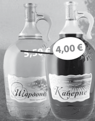
Slnko Cabernet Sauvignon 2 l Slnko Chardonnay 2 l