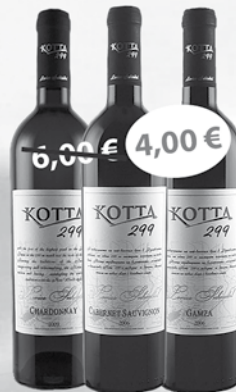
Kotta 299 Chardonnay 0,75 l Kotta 299 Sauvignon Blanc 0,75 l Kotta 299 Gamza 0,75 l Kotta 299 Cabernet Sauvignon 0,75 l