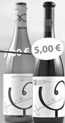
Jamantiev's Viognier 0,75 l Jamantiev's Pinot Noir 0,75 l