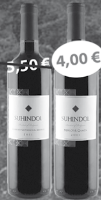
Suhindol Cabernet Sauvignon & Mavrud 0,75 l Suhindol Merlot & Gamza 0,75 l Suhindol Chardonnay & Traminer 0,75 l