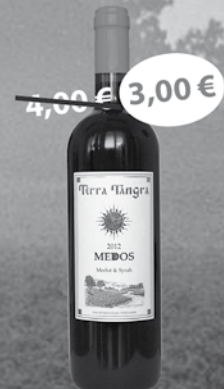
Medos Terra Tangra 0,75 l