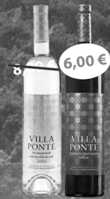
Villa Ponte Chardonnay & Sauvignon Blanc 0,75 l Villa Ponte Cabernet Sauvignon & Syrah 0,75 l

Pri nákupe bulharských vín v hodnote nad 25,00 € v období od 1.10.2013 do 31.12.2013 budete zaradení do zrebovania o tieto ceny: