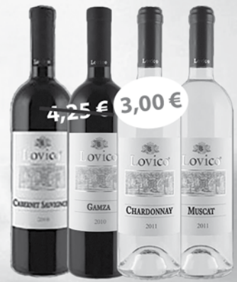
Lovico Cabernet Sauvignon 0,75 l Lovico Gamza 0,75 l Lovico Chardonnay 0,75 l Lovico Muškát 0,75 l