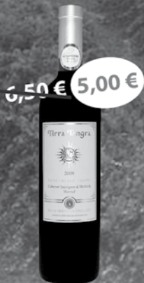
Organic Terra Tangra cuvee 0,75 l