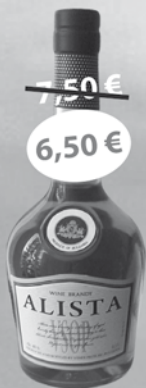
Brandy Alista VSOP 0,5 l 40%

Do každého pohára vína vkladáme aj kúsok lásky. To Vás robí našimi priateľmi.